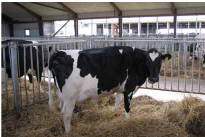
Køer i højt huld æder mindre efter kælvning. Derfor taber de sig mere og er mere modtagelige for sygdomme

“Forklaringen er, at køer i højt huld æder mindre efter kælvning.