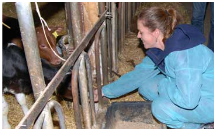
Ministeren i snak med besøgets hovedpersoner - kalvene.

Ministeren blev også gjort opmærksom på de udfordringer, der